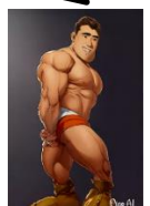
サイドトライセップス