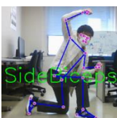
サイドバイセップス