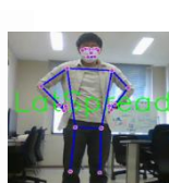
ラッドスプレッド