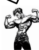
ダブルバイセップス