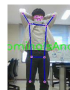
アドミナル・アンド・サイ